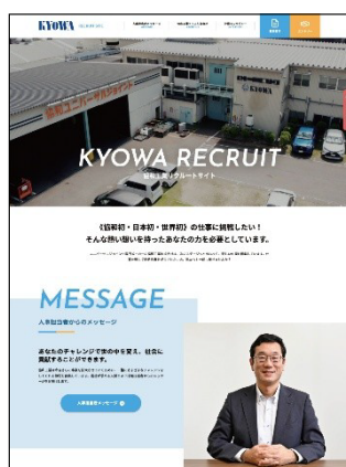
協和工業株式会社 様