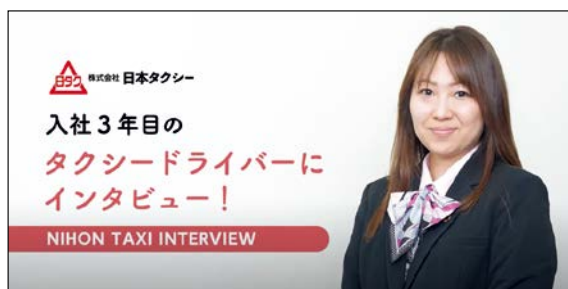
株式会社日本タクシー 様