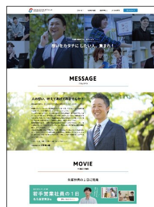
西濃印刷株式会社