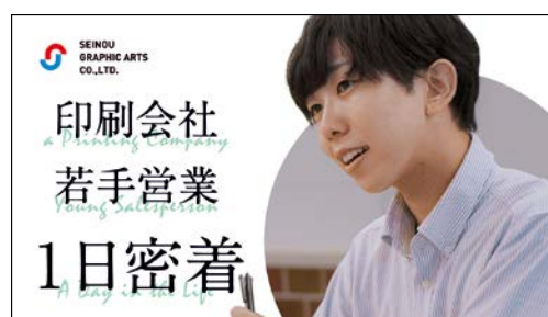
西濃印刷株式会社