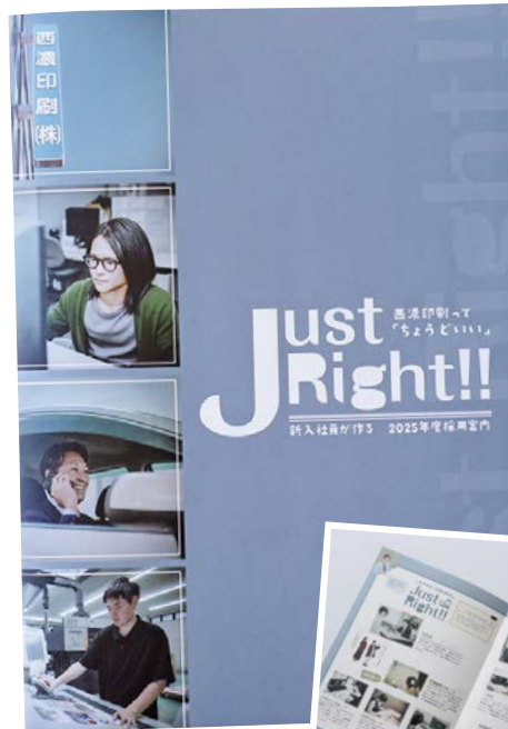
2024年度新入社員が 制作した会社案内